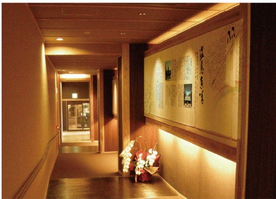
スパテラス水月へと向かう回廊天原ギャラリー

回廊を進んでゆくその先には、スパテラス水月「くうみの湯」。「淡路棚田の湯」が旅人たちを温かく迎えてくれます。湯船に浸かりながら、太古の海を眺め、悠久のひとときを過してみたいいかがでしょうか。