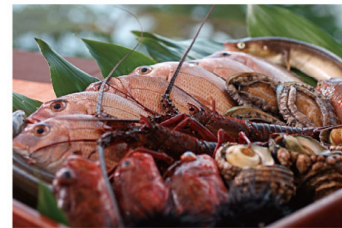
四季折々の豊かな食材

食向かふと、枕詩に詠まれる淡路島は美味食材の宝庫として広く人々に知られています。